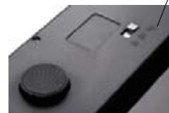
Přepínač jednotek vážení